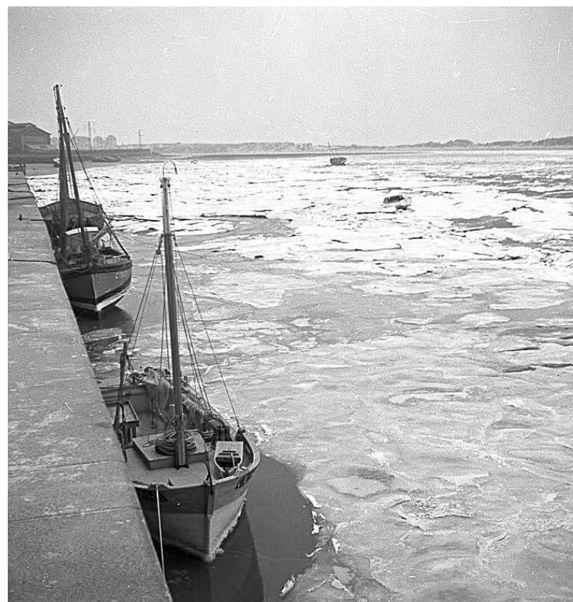
L'hiver 1962-1963 fut l'un des plus rigoureux du siècle ainsi qu'en témoigne cette photo (23 janvier 1963) du port de Dives-sur-Mer pris par les glaces.

Le 26 décembre un incendie se déclare dans une ferme à Épinay-sur-Odon : il faut avertir un par un les pompiers de deux casernes car les